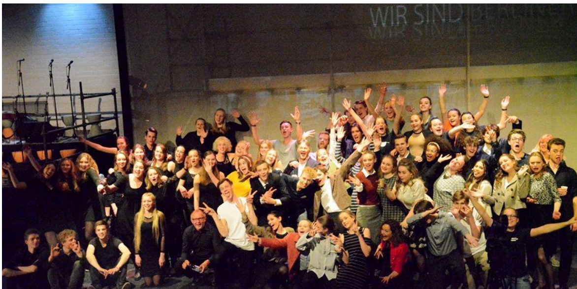
Bonhoeffercollege Castricum ligt op loopafstand van station Castricum.

Zoals, grime, tekstschrijven, decorontwerp/bouwen, dans enz.